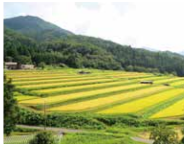
カタチにしたい奥出雲をイメージ