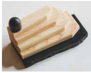
入賞作品はカタチ化